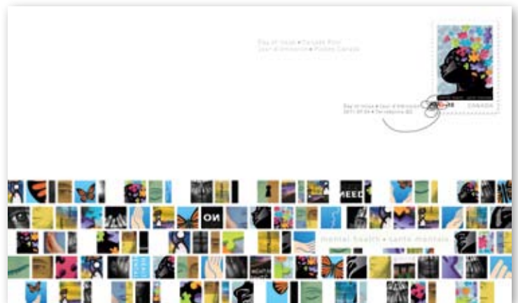
OFDC PPJO 413800131 $ 1 69