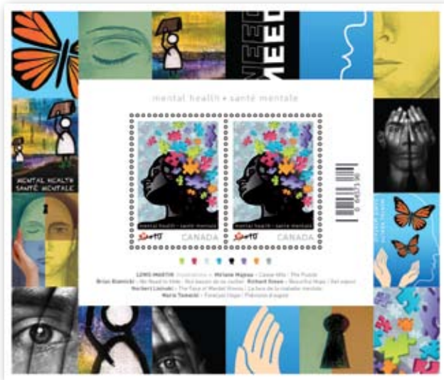
Souvenir sheet Bloc-feuillet 403800145 $ 1 38

These 20 entries were brought before Canada Post's Stamp Advisory Committee, and five designs were selected as semi-finalists. In February 2011, those five were revealed to members of the public, who voted on their favourites. The design that received the most votes became our 2011 Mental Health PERMANENT™ domestic rate semi-postal stamp, issued with a 10-cent surcharge to generate funds for the Foundation.