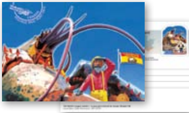
Postcard Carte postale 262268 $ 1 89

We landed into Wawa, Ontario, which means "wild goose" in Ojibwe. There, the giant steel Wawa Goose stood ready for flight, reminding us that the town is a stopover for flocks of Canada Geese headed south for the winter. Still moving east, we were spellbound by the beauty of Quebec's Côte-Nord region, when we came across a giant Atlantic Puffin in Longue-Pointe-de-Mingan. By then, it was time to rest up for the remainder of the trip, further east to the Atlantic provinces. ☒