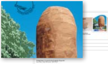
Postcard Carte postale 262266 $ 1 89