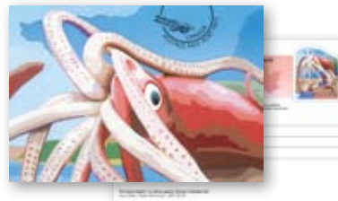
Postcard Carte postale 262267 $ 1 89