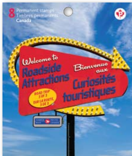
Booklet Carnet 413797111 $ 4 72

The next stop was a "sign" of great things to come. In Watson Lake, YK, one will find sign-post forest situated right in the middle of a majestic patch of untamed wilderness. In 1942, it seems, a homesick U.S. Army G.I. was working on the Alaska Highway. To ease his loneliness, he put up a sign pointing the way and showing the mileage to his hometown. Soon, others got the same idea and the Watson Lake Sign-Post Forest's count today exceeds 64,000 signs.