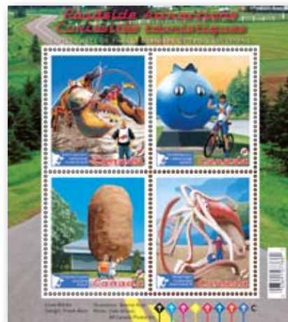
Souvenir sheet Bloc-feuille 403797145 $ 2 36